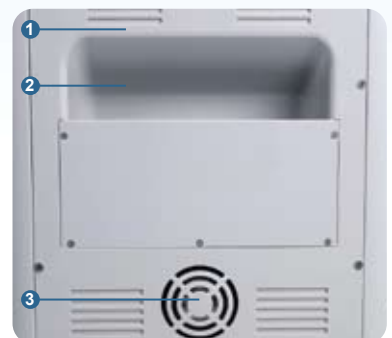
① 維修蓋 ② 置物箱 ③ 散熱風扇